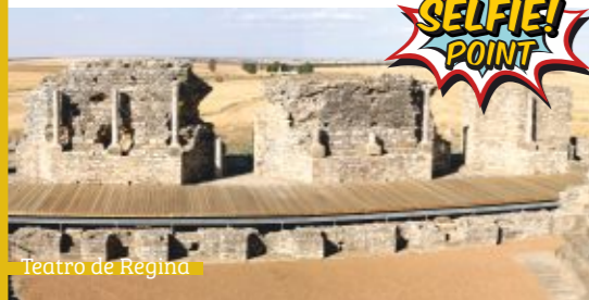
Teatro de Regina

Los restos de la ciudad romana de Regina Turdulorum , en el municipio de Casas de Reina, forman un conjunto en perfecto estado de conservación en el que destacan el foro y un teatro del siglo I d.C. con capacidad para más de 1000 espectadores. En los meses estivales se celebra el Festival de Teatro de Regina, vinculado al de Mérida.