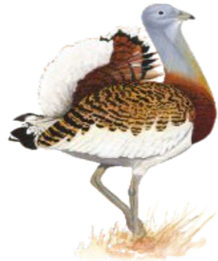
Avutarda ( Otis tarda )

La comarca cuenta con dos Zonas de Especial Protección para las Aves en las que disfrutar de esta actividad: la colonia de cernicalo primilla del casco histórico de Llerena y la ZEPA Campiña Sur, con una extensión de casi 45.000 h, que cuenta además con dos observatorios de aves situados en la laguna de Tres Perrillas y el embalse de Arroyo Conejos, en los que disfrutar de aves esteparias como la avutarda, acuáticas, limícolas e invernales como el importante contingente de grullas que nos visita cada año. Hay señalizados 13 puntos interpretativos sobre avifauna; además, para el avistamiento de rapaces y carroñeras destaca el observatorio de aves situado en el parque periurbano de conservación y ocio la Sierra, de Azuaga.