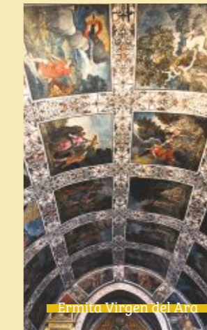
Ermita Virgen del Ara

Conjunto Histórico e iglesia de Ntra. Sra. de la Consolación, mayor exponente del gótico isabelino extremeño.