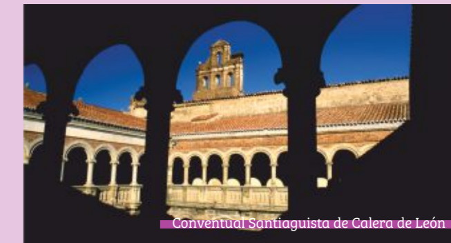
Conventual Santiaguista de Calera de León

A 9 Km de Calera de León con magníficas panorámicas.