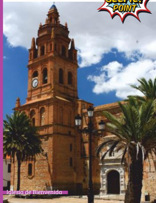
Iglesia de Bienvenida