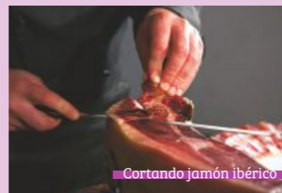
Cortando jamón ibérico

La comarca es un destino gastronómico. Su producto estrella es el jamón ibérico, regulado por la D.O. Dehesa de Extremadura y formando parte del Club de Producto Ruta del Ibérico Dehesa de Extremadura, aquí se producen jamones de fama mundial. A este delicioso producto hay que unirle otros derivados del cerdo ibérico como los embutidos y los comunes a la gastronomía extremeña.