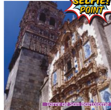
Torre de San Bartolomé