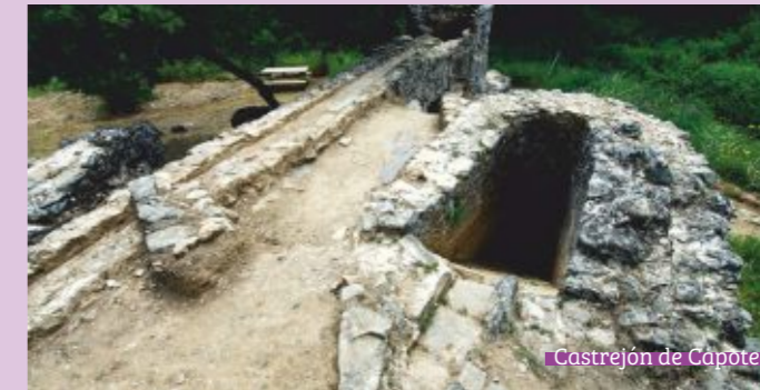
Castrejon de Capote