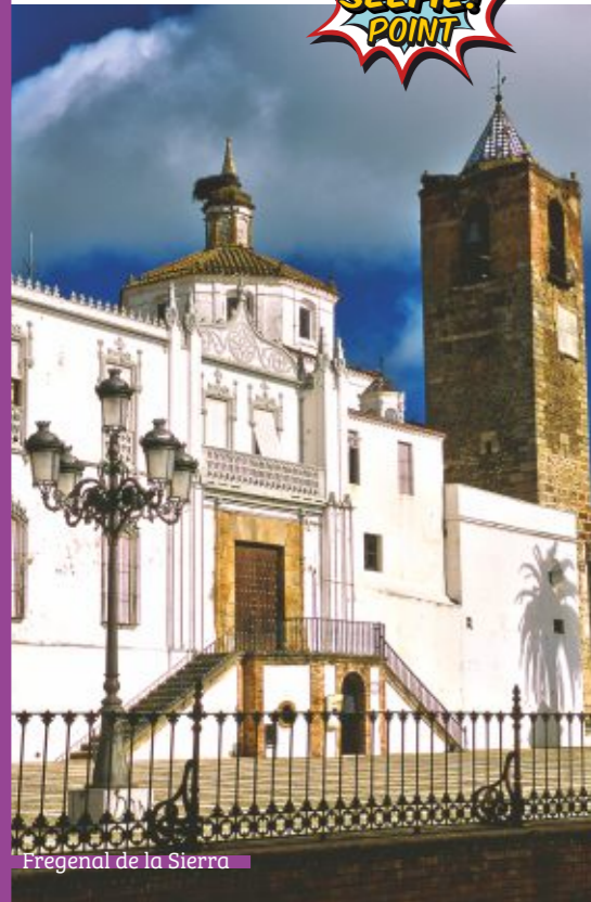
Fregenal de la Sierra