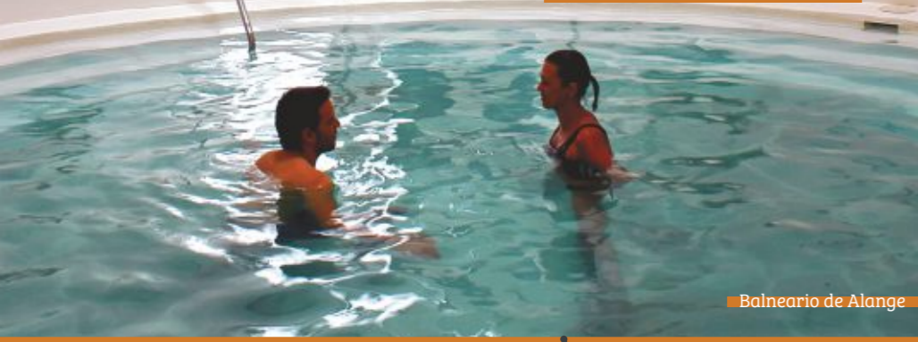
Balneario de Alange

Fueron los romanos en el s. III d.C. quienes descubrieron estas termas y posteriormente los árabes quienes también aprovecharon las facultades de estas aguas. Se trata de un remedio terapéutico tradicional y una experiencia única de salud y relax que se encuentran incluidas dentro del conjunto histórico monumental de Mérida y son también Patrimonio de la Humanidad.