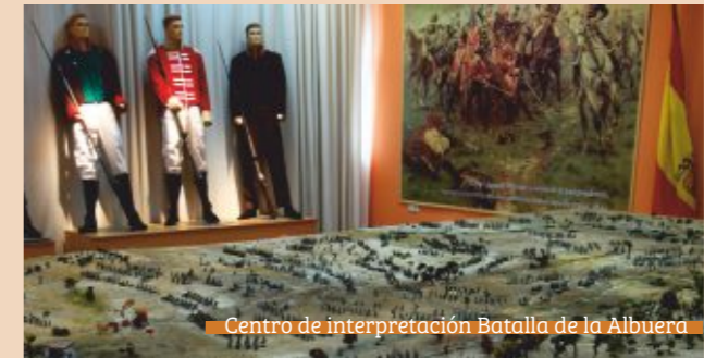
Centro de interpretación Batalla de la Albuera