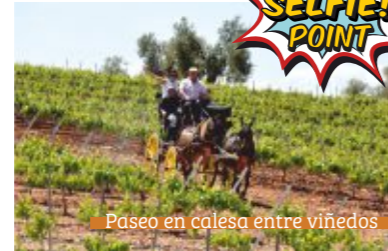
Paseo en calesa entre viñedos