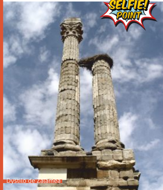
Distylo de Zalamea