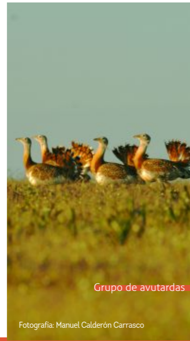
Grupo de avutardas

Considerado como uno de los ecosistemas faunísticos más importantes de Europa, teniendo casi la mitad de su territorio protegido medioambientalmente y dentro de la Red Natura 2000. Cuenta con una solvente red de observatorios ornitológicos, destacando Puerto Mejoral en Benquerencia de la Serena.