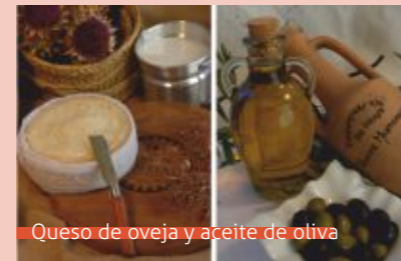
Queso de oveja y aceite de oliva

Cuenta con diversas denominaciones de origen, como la D.O. Quesos de La Serena, elaborado con la mejor leche producida exclusivamente por las ovejas merinas, y la D.O. Aceite Monterrubio, una de las dos presentes en Extremadura. También hay que resaltar los embutidos, los corderos, con IGP Corderex y el turrón de Castuera, tradicional y considerado Alimento de Calidad.