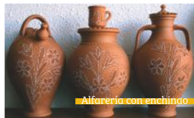
Alfarería con enchinado

En agosto se celebra el "Descenso del Alagón" en canoa, piragua o kayak, una cita para todos los públicos que une deporte, naturaleza y aventura. También puedes realizar el descenso del río Erjas a principios de abril.