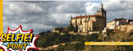
Catedral de Coria

La comarca posee dos conjuntos históricos: Coria, con sus murallas romanas, castillo y catedral; y Galisteo (imagen página anterior), de muralla almohade y un bello ábside mudéjar. Montehermoso conserva originales viviendas tradicionales y cuenta con un singular parque arqueológico etnográfico. Destacan otros núcleos urbanos como Ceclavín y Zarza la Mayor en los límites del parque natural del Tajo Internacional.