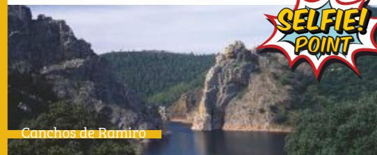
Canchos de Ramiro

Esta espectacular portilla de cuarcita sobre el río Alagón es uno de los mejores lugares para la observación de aves en Extremadura, en concreto desde el lugar conocido como el Boquerón: buitres leonados, halcones peregrinos, águilas reales, perdiceras... y en época estival cigüeñas negras y alimoches. Se accede por un sendero de unos 4 km que parte de las inmediaciones de Cachorrilla.