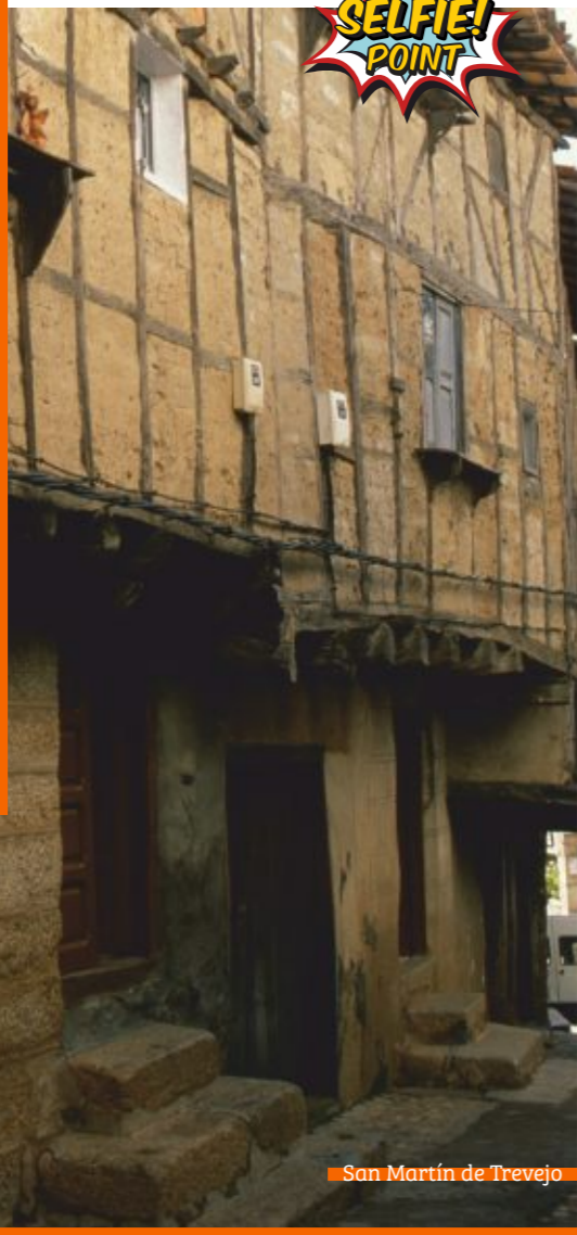
San Martín de Trevejo